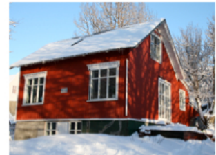
Island – Reykjavic

Vores data fra denne periode med intens aktivitet fortæller os meget om det kommende år. Her er for eksempel listen over de 20 populæreste lande i søgningerne for sommeren 2016: