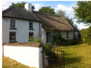
Irland – Kilkenny