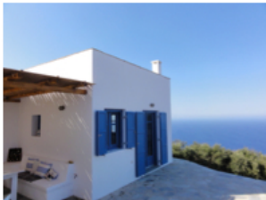
Grækenland – Folegandros

Marts, 2016 - Mens januar og februar normalt er lavsæson for turistbranchen på den nordlige halvkugle, er der travlhed hos BytBolig. I de første to måneder af 2016 har siden haft en stigning i trafikken på 60% sammenlignet med december måned. Erfarne boligbytttere ved godt, at det er nu, man skal slå til, hvis man vil sikre sig sin drømmeferie med BytBolig, især hvis man er bundet af bestemte datoer.