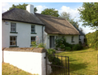
Irlanda – Kilkenny