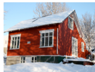
Islanda – Reykjavic

I dati relativi a questo periodo di grande attività ci dicono molto sul turismo dell'anno in corso. Per esempio la lista qui sotto elenca le 20 destinazioni più richieste per l'estate 2016: